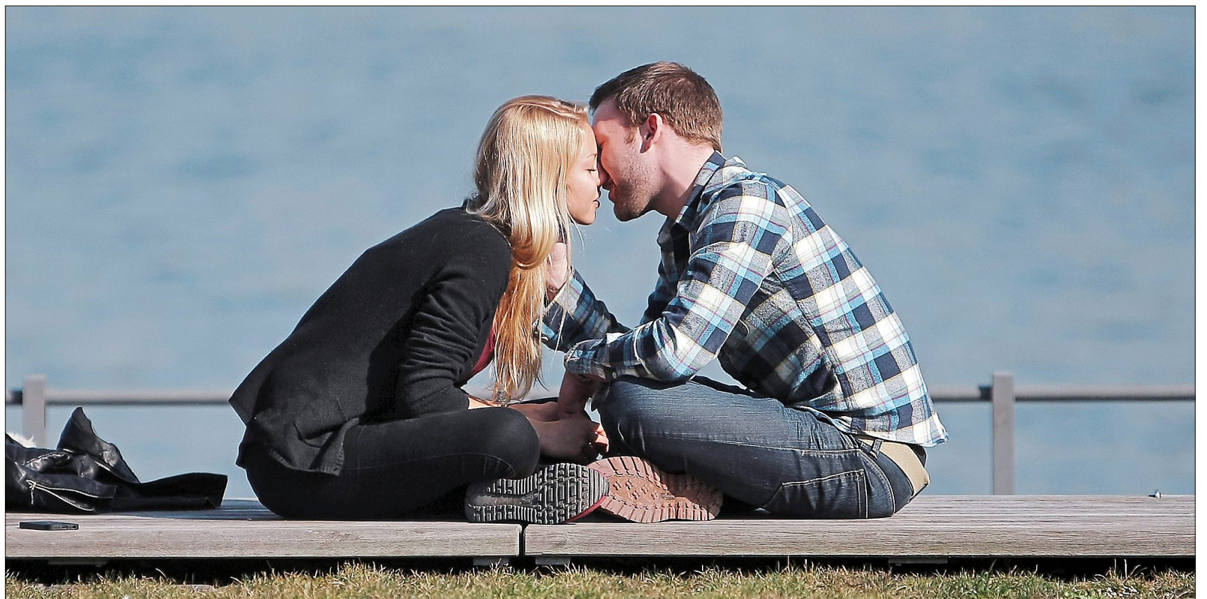
Für uns Menschen gibt es keinen Grund hochmütig zu sein, auch wenn das Gefühl des Verliebtseins erhebend ist: Unser Liebesleben folgt ähnlichen Urinstinkten, wie wir sie aus dem Tierreich kennen.

L iebe ist eine Elementarkraft – ganz gleich, ob sie sich in sexueller oder in spiritueller Form manifestiert. Denn sie kann die Welt zum Guten wie zum Bösen verändern: Sie kann die Wirklichkeit um uns herum verzaubern und vorübergehend in einen Paradiesgarten verwandeln, und sie kann sich wie eine unerfüllbare Sucht in unserem Körper ausbreiten und uns die Hölle auf Erden bereiten. Das haben die moralinsauren Wächter von Tugend und Anstand schon früh erkannt und den unkontrollierbaren Born von Liebe und Sexualität durch lebensfeindliche Gebote zu kanalisieren versucht. Das haben aber auch die selbstberufenen Apostel der freien Liebe erfasst und das bewährte Konzept der Zweierbeziehung durch ein promiskuitives Experimentierfeld der Lüste ersetzt. Doch Askese oder Lustgewinn – was brauchen wir tatsächlich in der Liebe? Der Evolutionsbiologe Thomas Junker steht uns Rede und Antwort, zu welchen Formen der Liebe wir von unserer stammesgeschichtlichen Natur her geschaffen sind und zu welchen nicht.