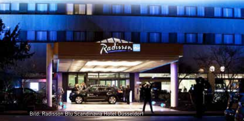
Bild: Radisson Blu Scandinavia Hotel Düsseldorf

Hotel direkt Tel.: +49 (0)211 4553 3500 E-Mail: reservations.duesseldorf@radissonblu.com